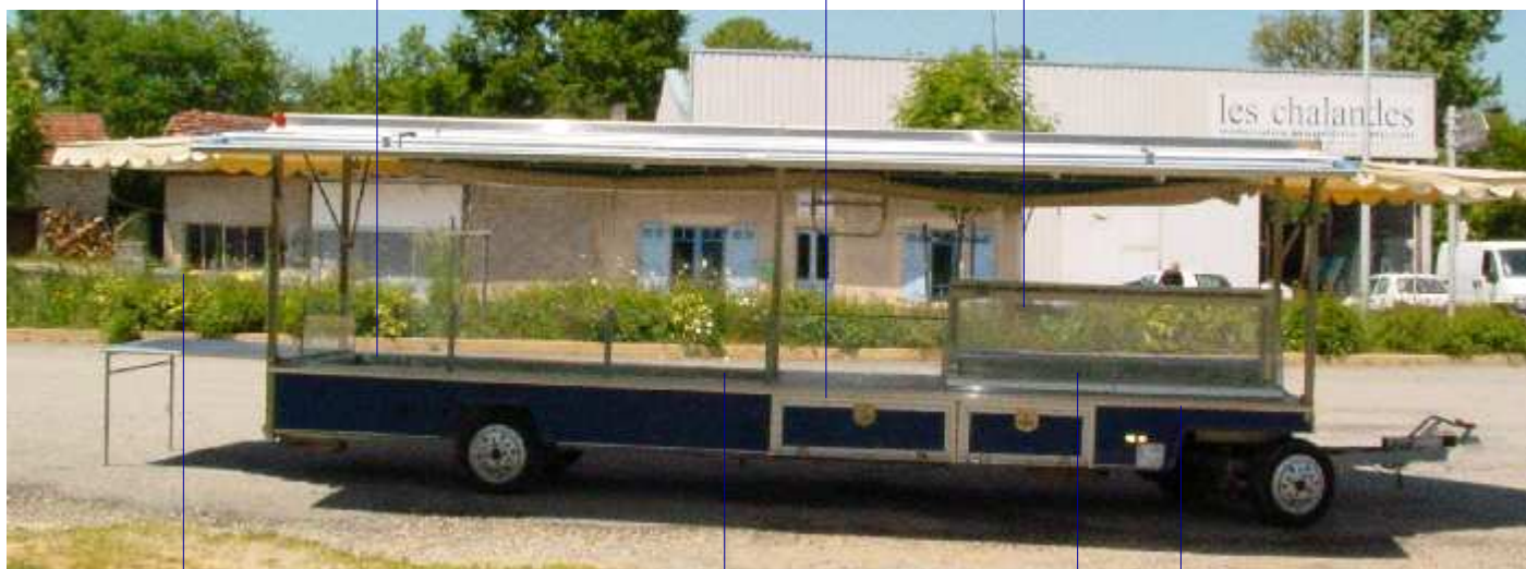
Table de rallonge 1,2 x 1 m

Vitrine réfrigérée par froid ventilé 1,9 m