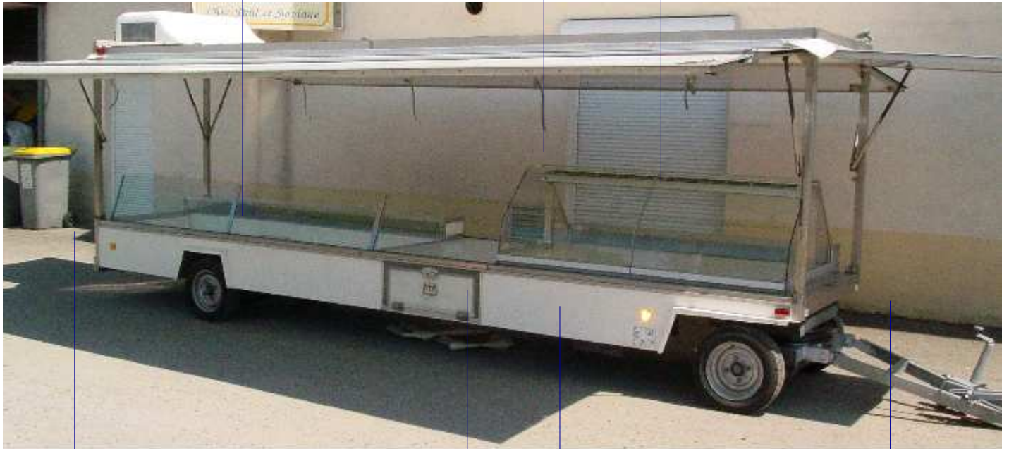
Table de rallonge inox 1,2 x 1 m

Vitrine réfrigérée par froid ventilé 1,9 m